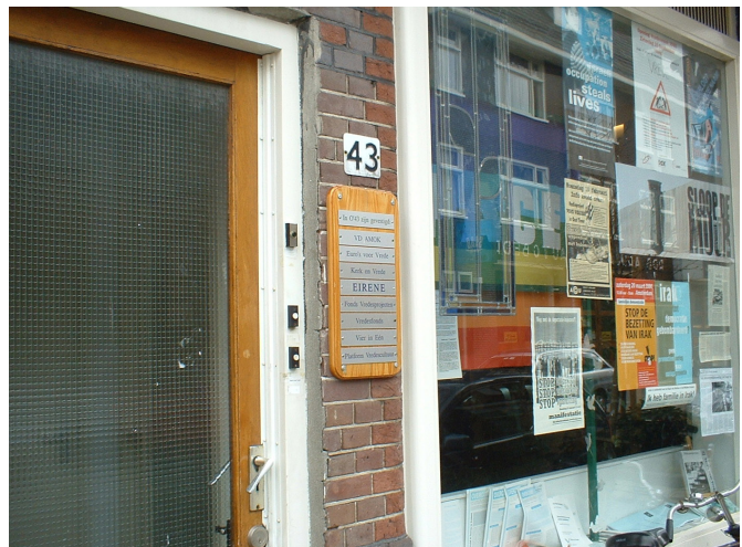
Ons oude kantoor in Utrecht